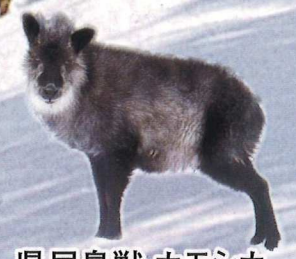
県民鳥獣 カモシカ